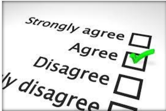
Sociaal kapitaal monitor